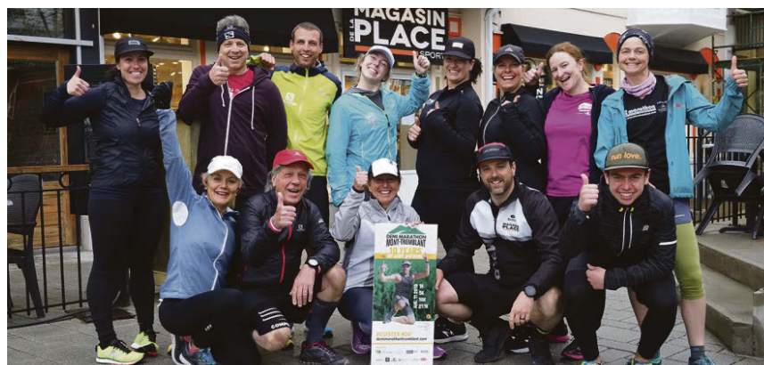
Le coup d'envoi d'une course pour le plaisir a été donné au Magasin de la Place, le 17 mai, pour souligner le lancement de la saison 2019.