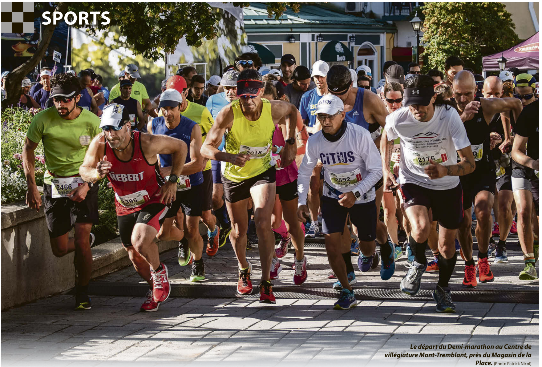
Le départ du Demi-marathon au Centre de villégiature Mont-Tremblant, près du Magasin de la Place.